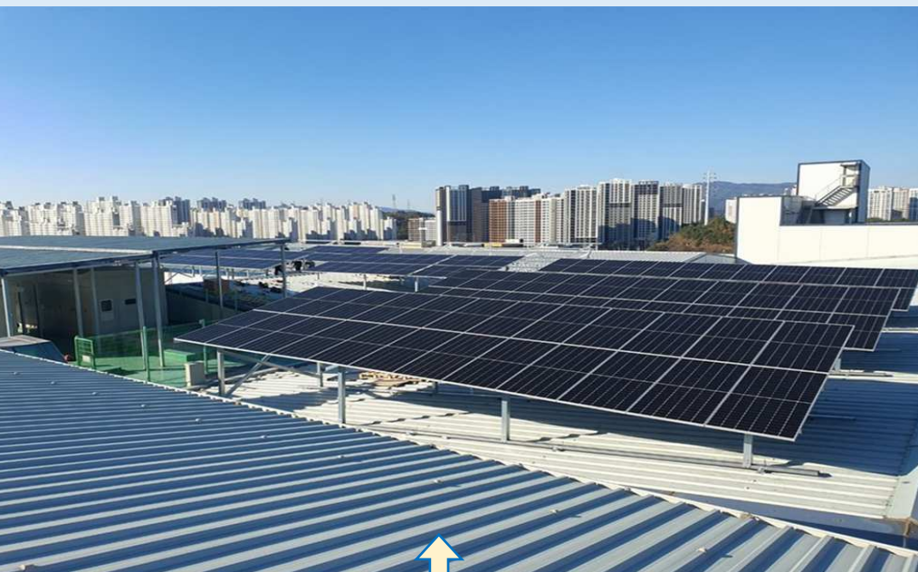
完成した第2工場屋根の太陽光発電設備