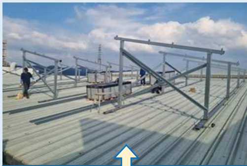
足組の組立作業(9月中~10月初旬)