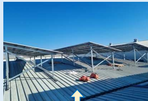
パネル組付け (10月中旬)