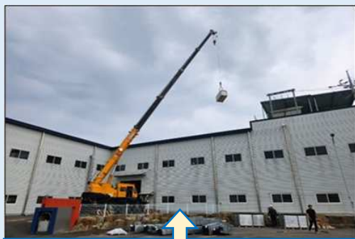
第2工場屋上へ資材搬入(9月初旬)

私たちはこれからも、TLG全拠点でカーボンニュートラルの取り組みを加速させ、脱炭素社会実現に向けた経営を進めていきます。このため、日々の活動においてCO2を「知る」「測る」「減らす」の3ステップを業務に取り入れていきます。