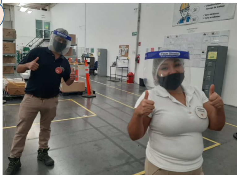
陽気なルミナスメキシコメンバーは大喜び