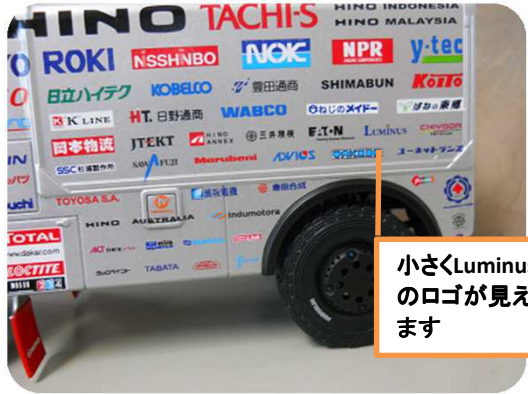
小さくLuminusのロゴが見えます