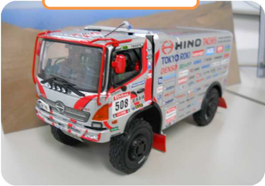
LIにあるモデル車両