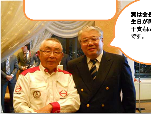
実は会長とは誕生日が同じ日で干支も同じなんです。