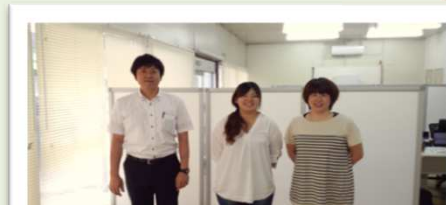
LSメンバーです！よろしくお願いします。