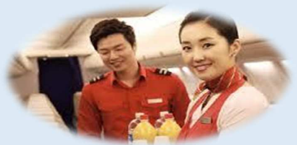
親切なフライトアテンダント

どちらを使うかは、緊急度によって異なりますが、時間的にも結構T-wayはいい感じで使えるかな、という感じです。航空運賃の比較だけではなく、そこからのアクセスやイミグレーションの時間など総合的に判断して利用することにします。