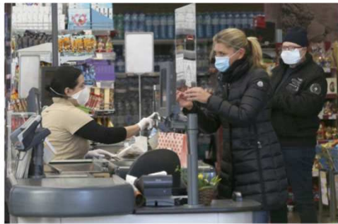
ウィーンの街角もマスク姿ばかり

メキシコ サンルイポトシ ルミナスメキシコ カロさん LMXでは残念な事に一人の感染者が出ました。家庭で感染したのですが、LMXではテレワークだったので社内感染はしていません。症状も軽微でした。LMXでは全員がPCR検査を行い、陰性証明が出たら、職場復帰する計画で、社内コミュニケーションを十分とって対応しています。