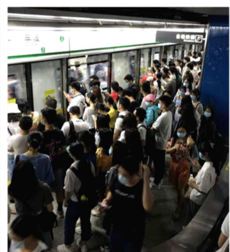
広州の地下鉄の混雑(全員マスクは着用)

中国 : 広州ルミナ 高さん 広州は去年のパニック状況から回復し感染者は今のところ出ていません。終息したようで、街の様子もほとんど元の状態に戻っています。ただ、完全に感染が落ち着いたかどうかは分からないので、GLでは従来通りの消毒とマスク着用を義務付けています。客先への訪問も許可されていますが、海外との往来はまだ一部だけです。