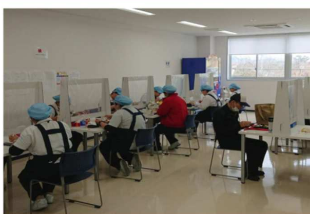
ルミナス佐賀の食堂で社テーブルに仕切りを置いて感染防止をしています。

中国 : 広州ルミナ 高さん 広州は去年のパニック状況から回復し感染者は今のところ出ていません。終息したようで、街の様子もほとんど元の状態に戻っています。ただ、完全に感染が落ち着いたかどうかは分からないので、GLでは従来通りの消毒とマスク着用を義務付けています。客先への訪問も許可されていますが、海外との往来はまだ一部だけです。