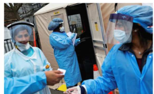
シカゴの街では検査が行われています

韓国 :ルミナス韓国 崔さん 韓国での感染は首都ソウルを中心に都市部で毎日500名と、第3波の様相を呈しています。政府の感染防止は極めて規制が厳しく行われており、感染者が出ると、スマホで行動の軌跡が明らかになり、同経路を移動した人にPCR検査を課しています。今週も、社員の家族が感染者と同じ経路を通っただけで強制隔離になり、検査を受けています。陰性でした。