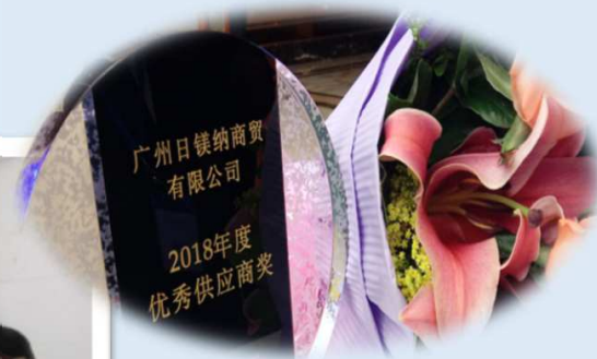
5年連続受賞を喜ぶ GLのメンバーと記念の盾