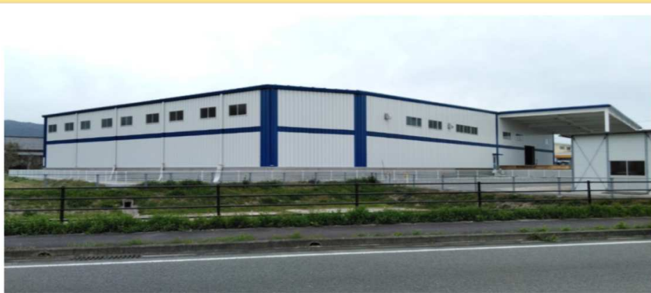
倉庫エリアとトラックヤード

ルミナス佐賀の建設工事は最終段階に入りました。 外装はほぼ出来上がり、玄関や門扉を残すだけとなりました。